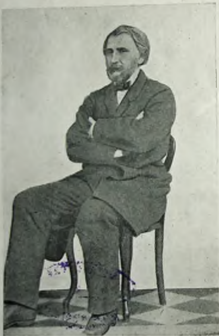
И. С. Тургенев. (СПб., 1850-е гг.).